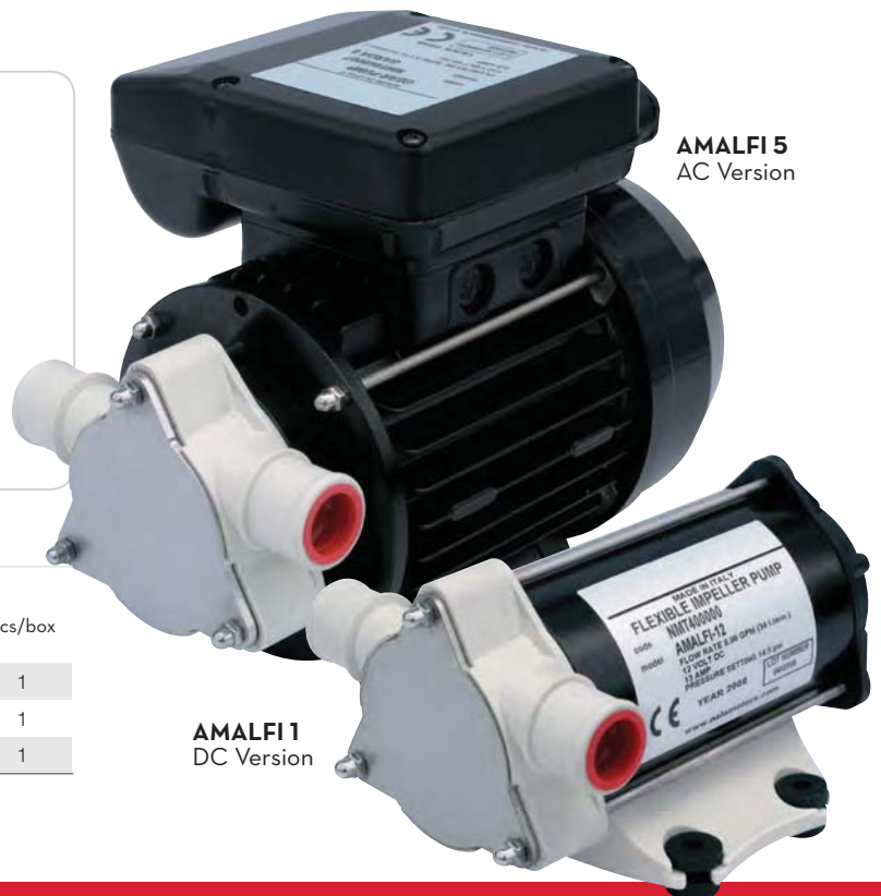
AMALFI 1 DC Version