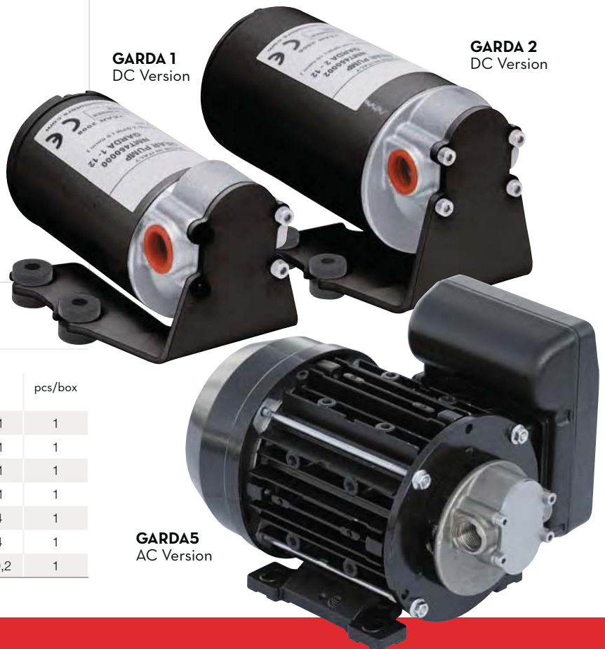
GARDA5 AC Version